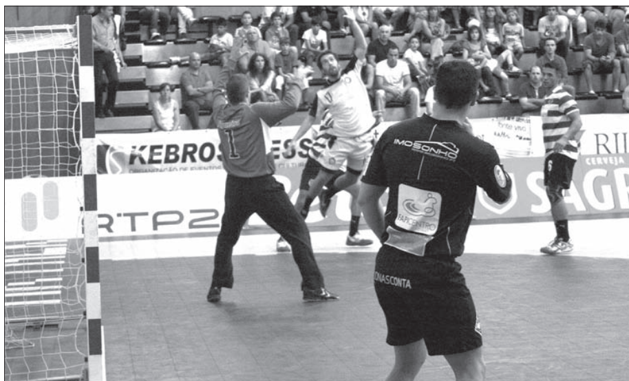
ABC-Sporting reencontram-se hoje no Sá Leite

O Andebol 1 arranca este fim-de-semana com dois clássicos, um a disputar hoje no Pavilhão Flávio Sá Leite (ABC-Sporting) e outro amanhã, na Luz (Benfica-FC Porto).