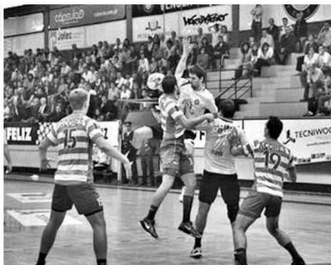
Na primeira jornada, hoje, o Sporting da Horta recebe o Madeira SAD