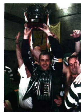
Alvalade fez a festa em 2000/01