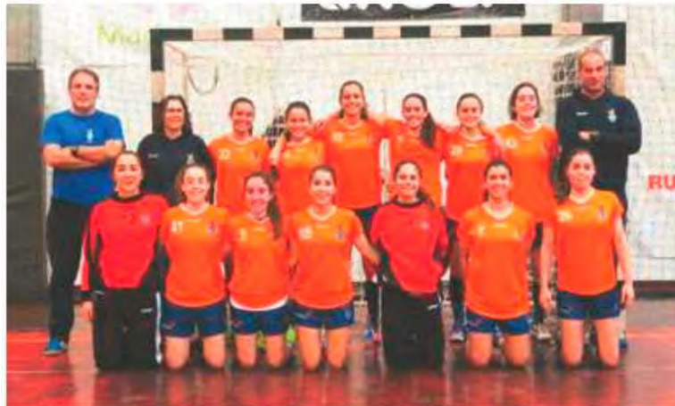
Equipa de juniores do CS Madeira em competição este fim-de-semana.

Hoje pelas 18 horas as juniores femininas defrontam o Alcanena e domingo a partir das 10 horas o Maia. Já as iniciadas, disputam a fase final em Alcanena e terão como adversário a formação da casa, o Alcanena, Leça e Alpendorada. Hoje às 18 horas jogam frente ao Leça, fechando no domingo esta prova pelas 10 horas contra o Alpendorada. H. D. P.