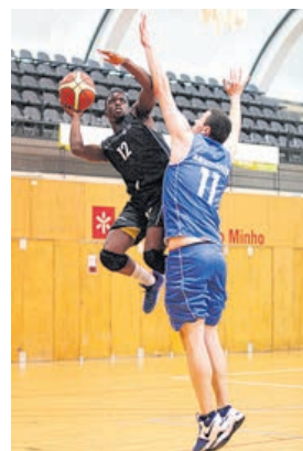
Final de basquetebol