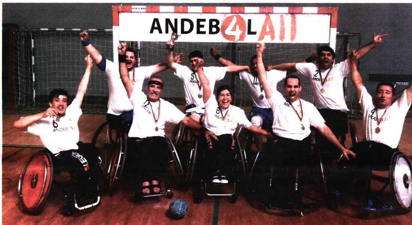
No último fim de semana, equipa conquistou campeonato nacional de andebol ACR4. Sábado luta pelo título de ACR7