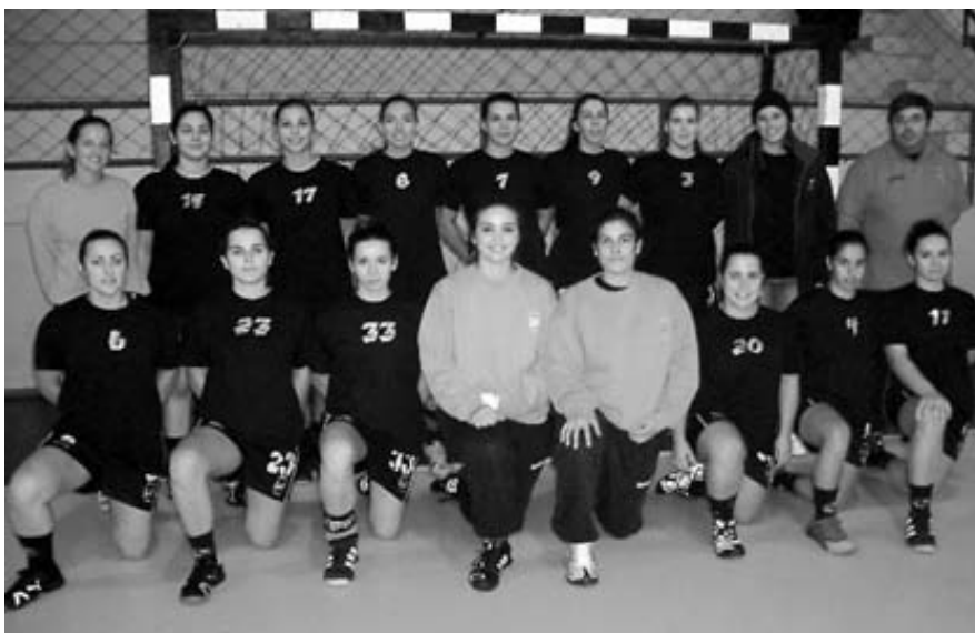
Equipa feminina da Juventude Mar disputa o campeonato nacional da I divisão

Para o técnico, que ao longo de onze anos se dedica à modalidade como treinador, este é “um feito de se lhe tirar o chapéu, e a demonstração de que uma equi-