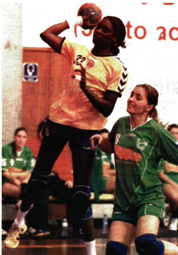
As madeirenses actualizam hoje frente ao Gil Eanes o seu calendário.

O Madeira SAD volta a competir hoje, defrontando às 12 horas em Lagos o Gil Eanes, campeão em título, naquele que é o encontro mais importante da temporada entre dois candidatos ao título.