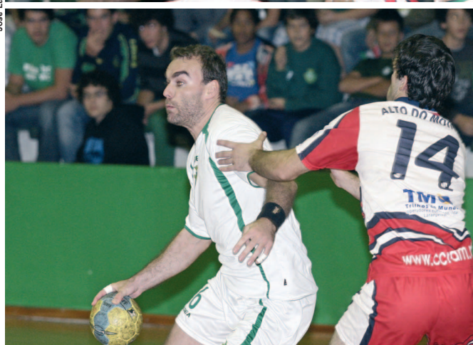
ESFORÇO – Vitorianos souberam reagir prontamente às dificuldades

período do segundo tempo o índice de concretização do Vitória subiu muito, com destaque para as finalizações da primeira linha que, na primeira parte, tinham sido o ponto mais fraco da manobra ofensiva.