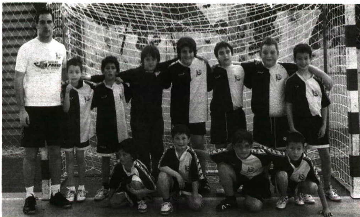
Minis (também) em "grande"