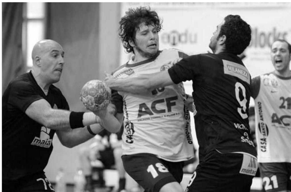
Os madeirenses recuperaram o 3º lugar com a vitória no reduto do Águas Santas.