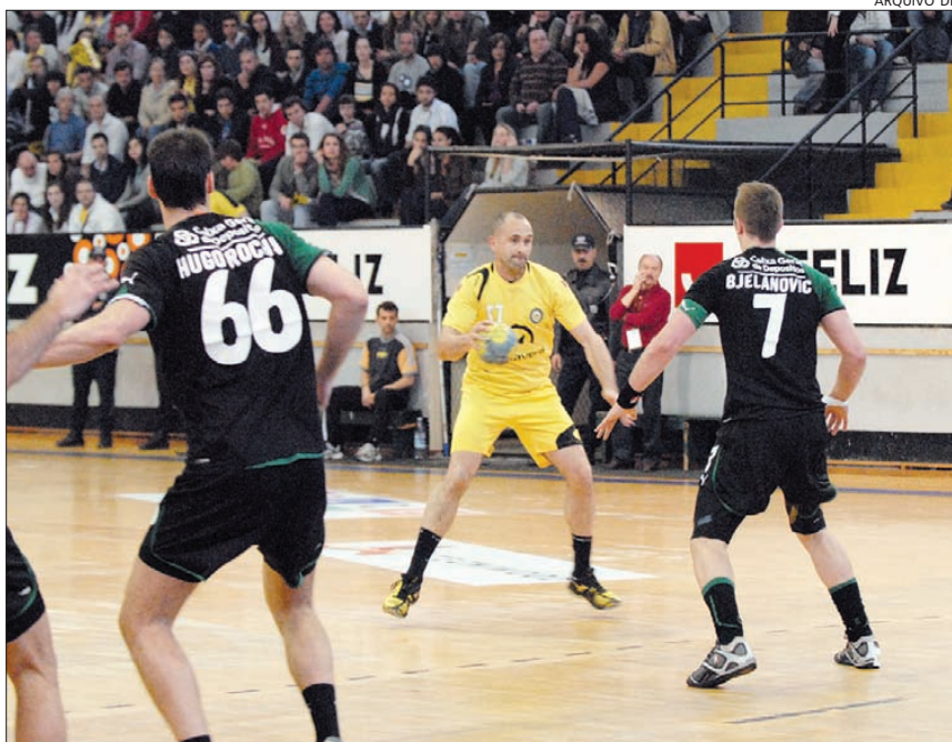
ABC não conseguiu somar novo triunfo no campeonato