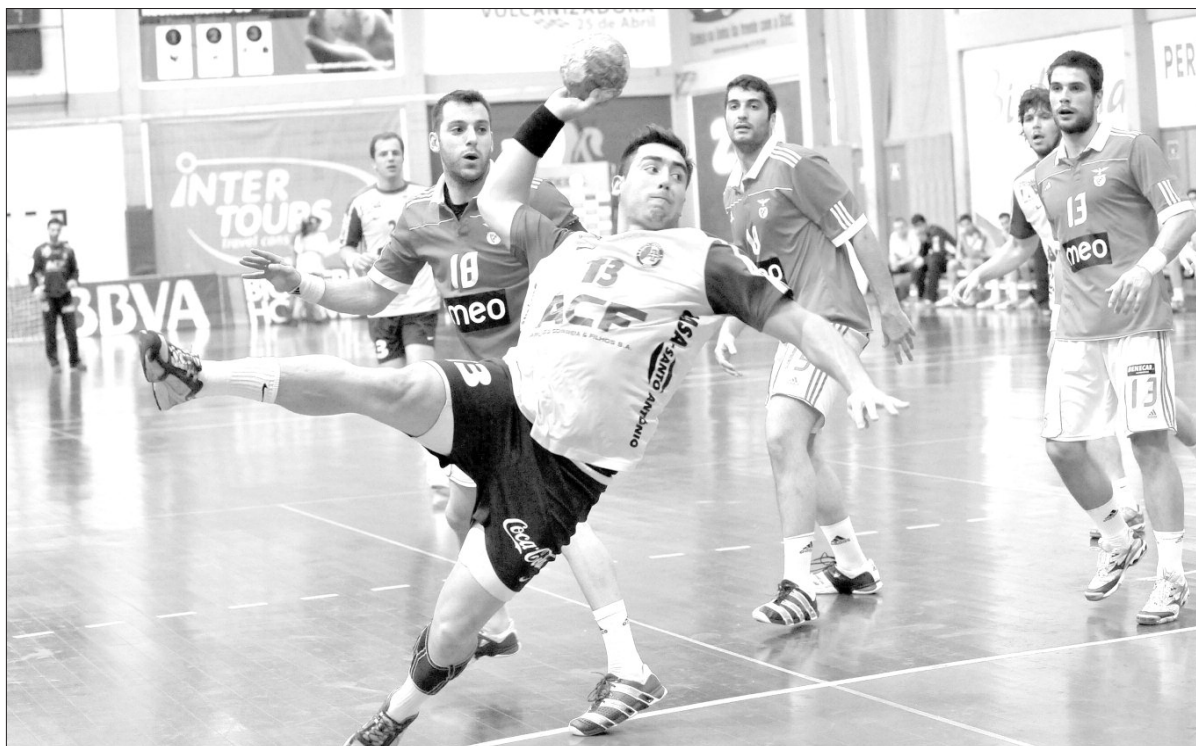
Insulares venceram no Norte do País, após duas derrotas consecutivas com Benfica e FC Porto. A luta pelo pódio continua bem acesa para a equipa de Paulo Fidalgo.