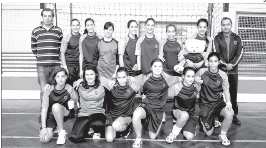
Equipa de iniciadas da Didáxis

venceram a formação do Moimenta da Beira por 25-11.