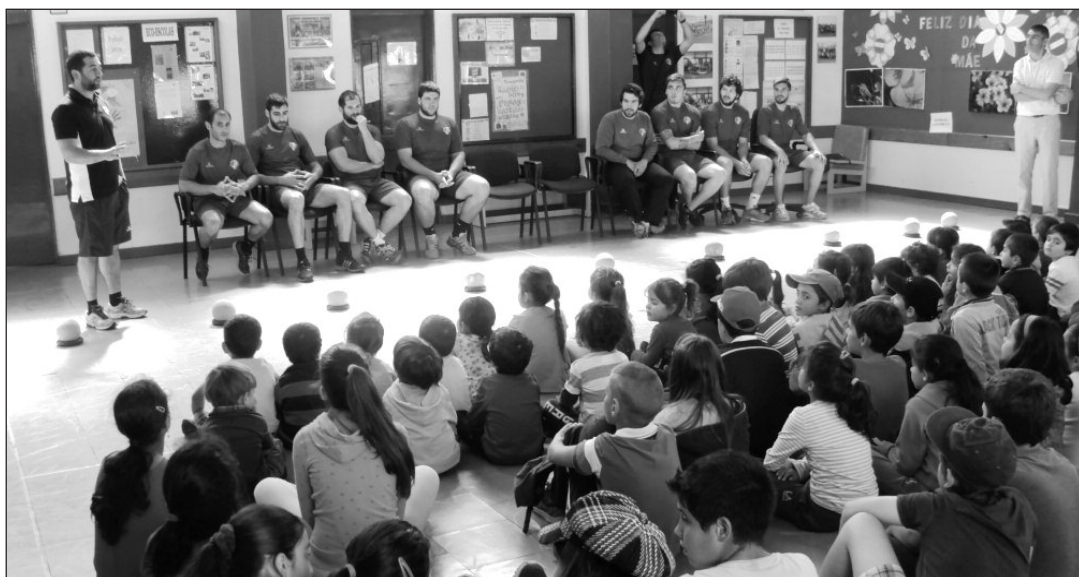
Jovens estudantes "deliciaram-se" com a presença de andebolistas do Madeira SAD

Ontem, na parte da manhã, decorreu na Escola Lombo do Guiné uma ação de sensibilização teórica-prática para as cerca 115 crianças que frequentam a referida escola sobre a modalidade de andebol onde os principais intervenientes foram oito jogadores, o treinador e o diretor técnico da equipa profissional do Madeira Andebol SAD.