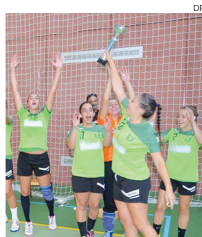
Atletas da SIR celebraram a conquista do troféu

prossegue no próximo fim-de-semana com a presença no VI SIR 1.º de Maio Andebol Cup a realizar no Pavilhão Nery Capucho, na Marinha Grande.