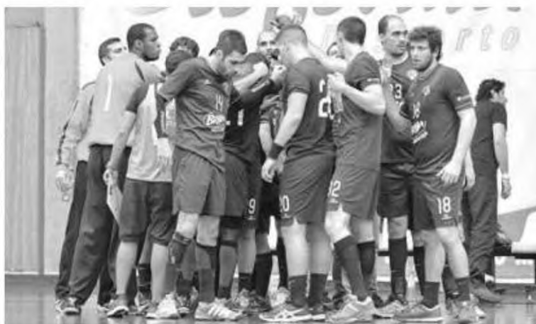
SAD masculina tinha garantido o acesso à Europa com o quinto lugar.

Contudo, esta participação da equipa madeirense na prova europeia, deve-se ao facto da Federação Portuguesa de Andebol, empenhada em ter uma equipa feminina nas competições europeias da próxima época, participar com parte das viagens. E. R.