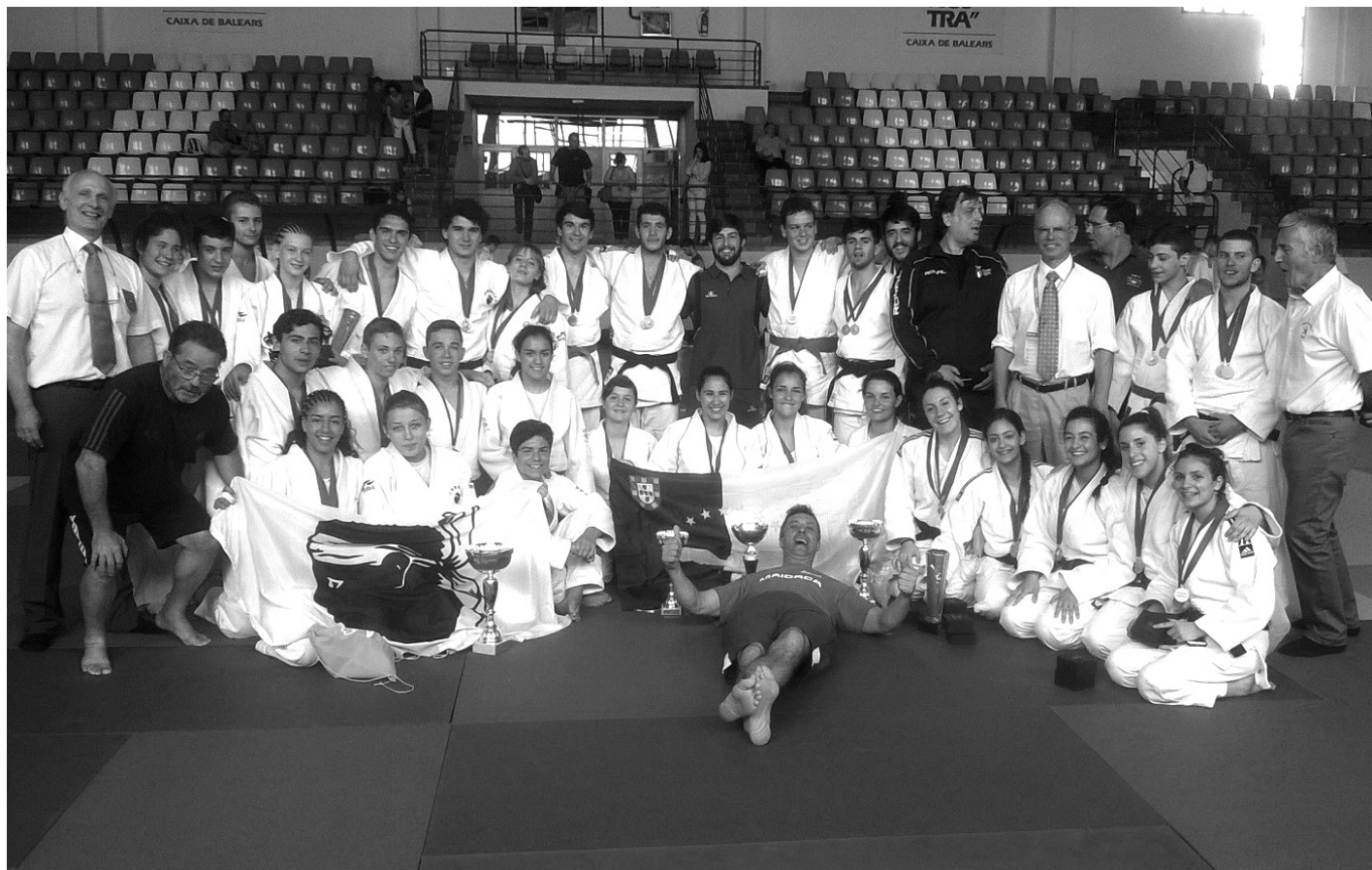
JUDO açoriano com presença sobremaneira importante nos XX Jogos das Ilhas

Judocas açorianos apenas ultrapassados pela Sicília (vencedora absoluta dos Jogos das Ilhas), Córsega e Baleares. Combates de excelente qualidade.