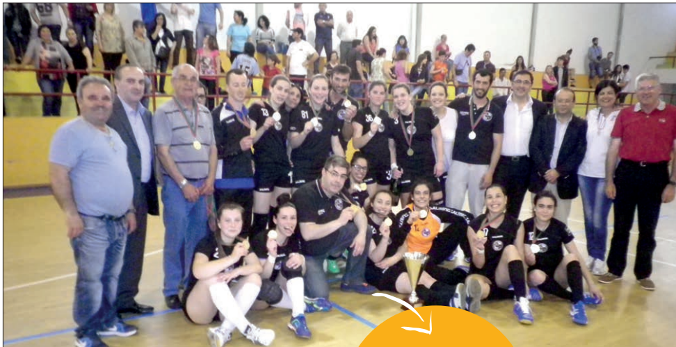
Juventude de Mar com o troféu e medalhas

Equipa de Esposende regressa à 1.ª Divisão nacional