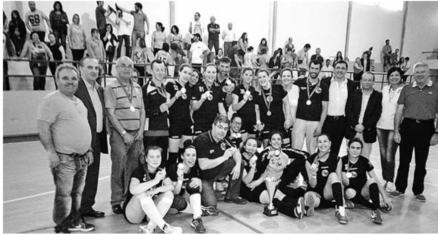
A festa da equipa da Juventude de Mar pela conquista do título da II Divisão Nacional de andebol feminino