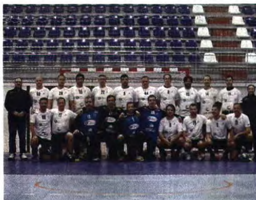
Ivan Del Val / Global Images