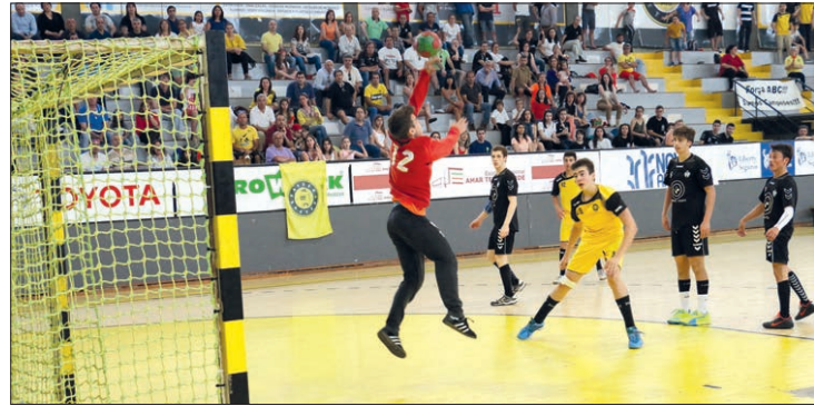
AD Sanjoanense perdeu jogo mas fez a festa no final