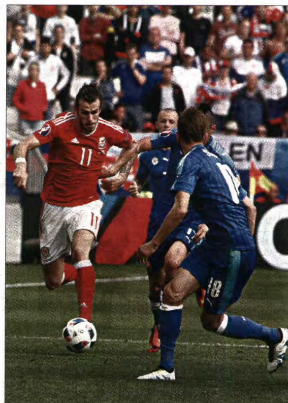
Gareth Bale conduz mais uma jogada de ataque da seleção galesa