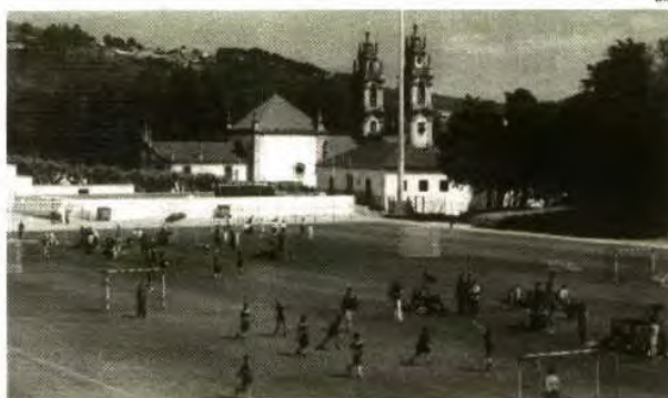
Palco do encontro foi o Estádio da Senhora dos Remédios

Foi um dia de festa para a centena e meia de alunos do 1.º ciclo que participaram no encontro, bem enquadrados