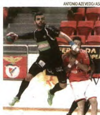
ANTONIO AZEVEDO / ASF

A confirmar-se, Portugal teria cinco representantes no masculino: ABC na Liga dos Campeões,