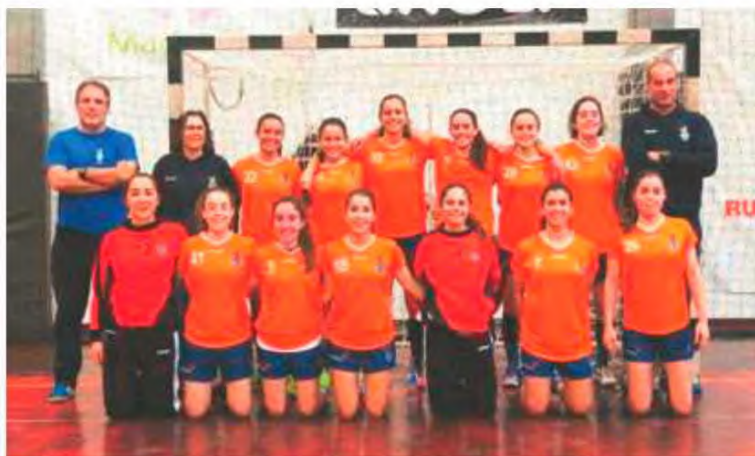
Equipa de juniores do CS Madeira em competição este fim-de-semana.

Hoje pelas 18 horas as juniores femininas defrontam o Alcanena e domingo a partir das 10 horas o Maia. Já as iniciadas, disputam a fase final em Alcanena e terão como adversário a formação da casa, o Alcanena, Leça e Alpendorada. Hoje às 18 horas jogam frente ao Leça, fechando no domingo esta prova pelas 10 horas contra o Alpendorada. H. D. P.