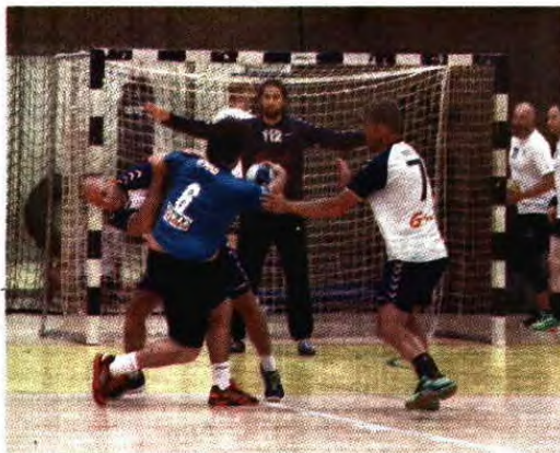
Masters Porto ao ataque no Europeu da Croácia