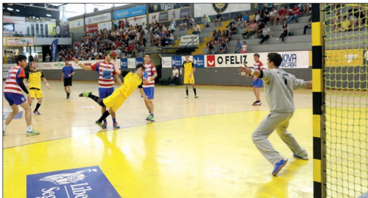
ABC venceu ontem o Sp. Horta por 32-25

Passando à explicação, o ABC "B" terá de vencer, hoje, a Sanjoanense por sete golos de diferença, is-