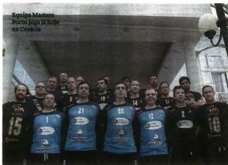
Equipa Masters Porto joga já hoje na Croácia

ANDEBOL Veteranos portugueses defendem título. Sérvios, letões e espanhóis são os primeiros adversários