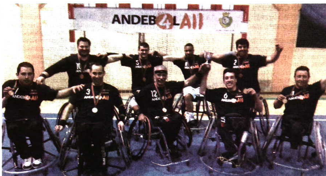
Leirienses são equipa com mais títulos conquistados na modalidade