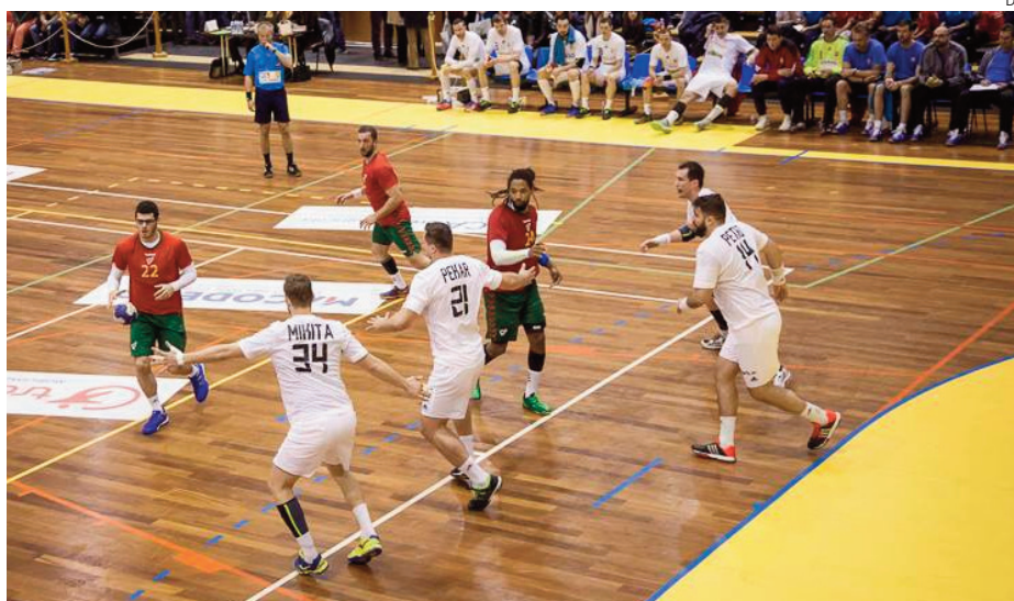
Equipa portuguesa venceu a Eslovénia por 33-23 no derradeiro encontro da competição

O torneio serviu para a selecção Portuguesa preparar o “play-off” de apuramento para o Campeonato do Mundo de França em 2017, no qual Portugal terá pela frente a selecção