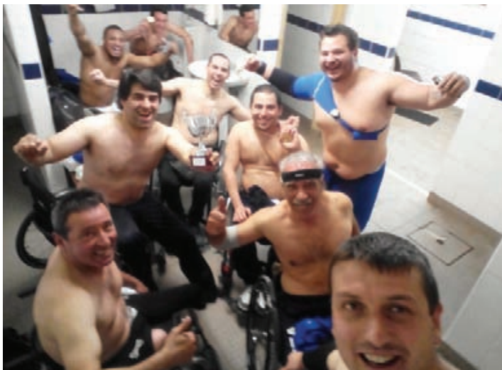
Os títulos continuam a ser festejados como se fossem o primeiro

“É uma vitória que resulta, acima de tudo, do nosso esforço e do nosso trabalho”, salientou o responsável da equipa que é, agora, a mais titulada do andebol em cadeira de rodas portugueses. É que além do campeonato agora conquistado, a APD Leiria tem já no seu palmarés os quatro títulos conquistados na temporada transactos: os campeonatos nacionais e as Taças de Portugal das variantes de quatro e de sete. O objectivo será alargar esse palmarés no próximo dia 23 de Abril, quando disputarem, na Torre da Marinha, Seixal, a fase final do Campeonato Nacional da variante de sete.