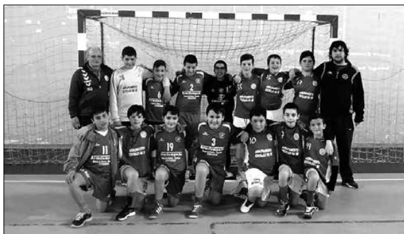
A. C. Lamego 22 – 5 Anreade

Este escalão do Andebol Club de Lamego está realmente a realizar uma época extraordinária e a cada jogo que passa nota-se a evolução individual dos seus atletas.