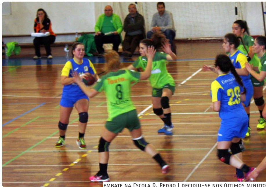
EMBATE NA ESCOLA D. PEDRO I DECIDIU-SE NOS ÚLTIMOS MINUTOS

A equipa de seniores femininos do Cister SA perdeu, no passado domingo, por 26-30, frente ao SIR 1.º Maio, a final da Taça Rui Faria, que decorreu no pavilhão da Escola D. Pedro I, em Alcobaça.