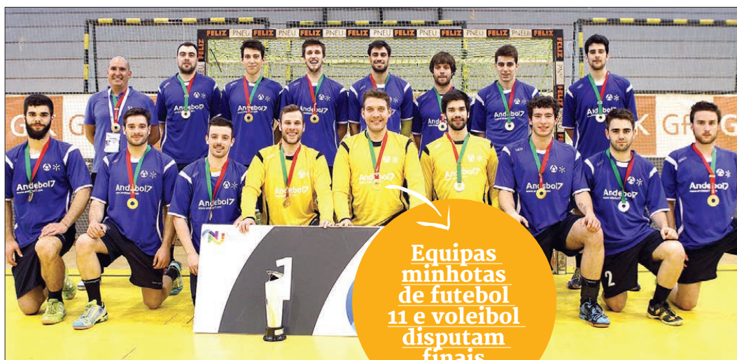
UMinho renovou título nacional de andebol masculino

A Associação Académica da Universidade do Minho terminou o dia de ontem dos campeonatos nacionais universitários com dois ouros e uma nova final garantida. Os campeões nacionais e mundiais universitários de andebol masculino voltaram a entrar em campo para uma final frente ao IPLeiria a quem venceram por 39-24.