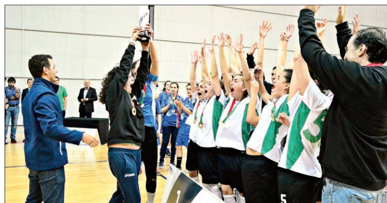
Aveiro conquistou o título feminino no andebol

Hoje disputam-se as meias-finais e final do hóquei em patins e as finais de basquetebol f/m, voleibol f/m e de futebol 11.