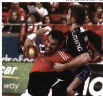
A BOLA TV transmite o Benfica-A. Santas

Por fim, mas não de somenos, temos a BOLA TV de novo em campo: