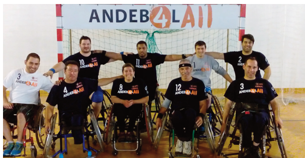
Equipa de Leiria venceu a de Lisboa na final

ANDEBOL ADAPTADO O Pavilhão Cidade de Viseu foi o palco das grandes decisões do 'andebol4all' em cadeiras de rodas (ACR). A 'final-four' da Taça de Portugal nesta vertente foi disputada pelas APD's de Lisboa, Braga, Leiria e pela Associação dos Amigos Rovisco Pais.