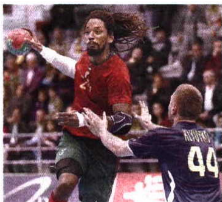
Nani Del Val / Global Images