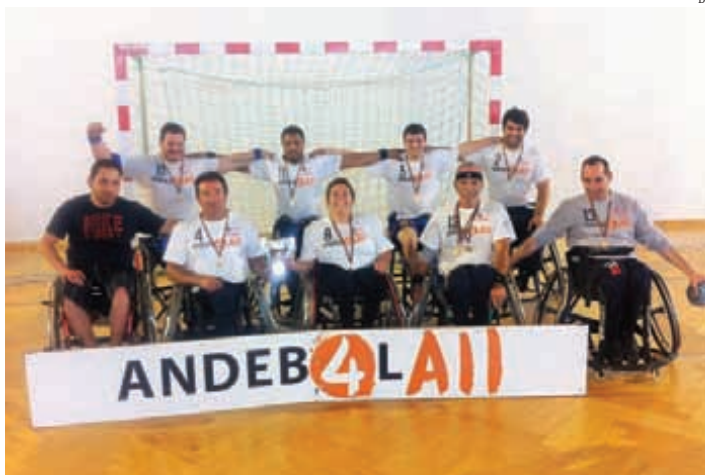
Grupo de heróis conquistou título para Leiria