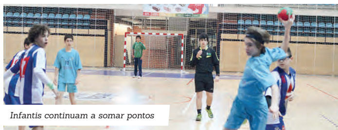
Infantis continuam a somar pontos

Nos diversos campeonatos regionais em que está inserido, as equipas de infantis e de juniores venceram os seus jogos frente ao Infesta (27-21) e CPN (26-24), respetivamente.