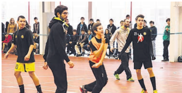
Jogadores do ABC em acção na Escola Secundária D. Maria II

“O Madeira Sad é uma equipa que apresentou dificuldades ao Águas Santas. Empataram. Te-