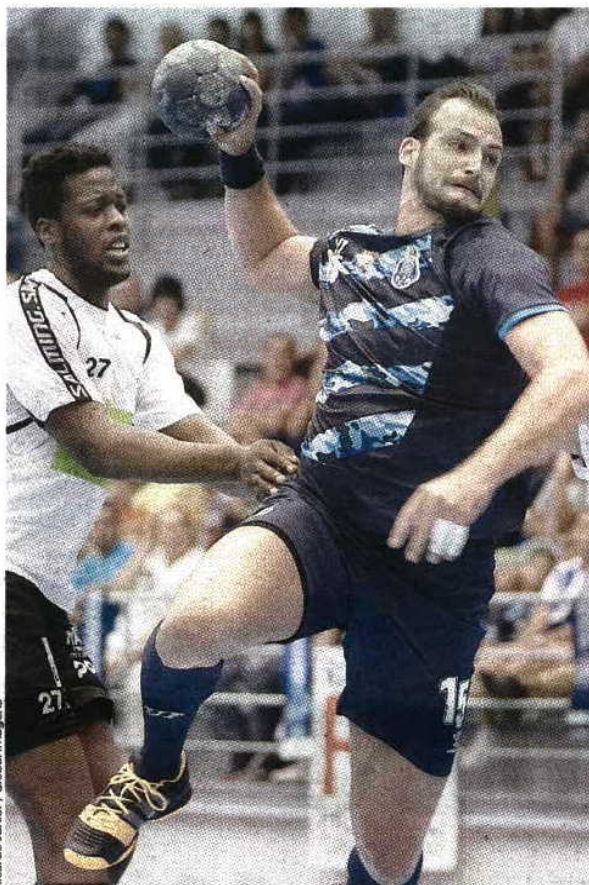
Ricardo Junior / Global Images

Roque, que conhece bem o adversário desta noite, sabe que "nunca é fácil jogar no pavilhão do Águas Santas, que