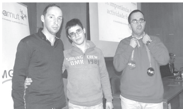
Participantes no encontro sobre Desporto Adaptado

A Associação de Apoio à Criança do Distrito de Castelo Branco no âmbito da comemoração do dia internacional das Pessoas com Deficiência promoveu, no dia 4 de dezembro, um encontro sobre desporto adaptado intitulado "A importância da Atividade Física para Pessoas com Deficiência Mental". O encontro teve lugar no auditório da Escola Superior de Educação com grande adesão dos alunos e técnicos da área do desporto, tanto ao nível do ensino superior como do