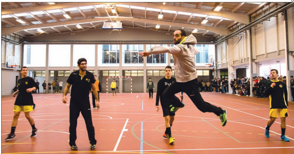
Na Escola D. Maria II, os atletas do ABC sentiram-se em "casa", ao encontrar muitos jogadores das camadas jovens do clube