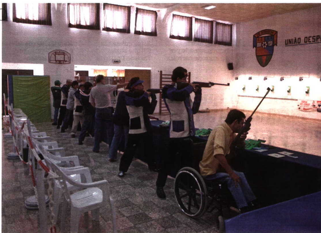
Próxima jornada de tiro desportivo realiza-se a 11 de janeiro. Cinco melhores são apurados para o nacional