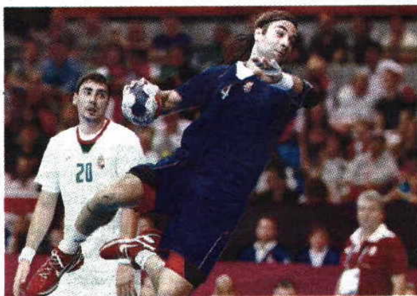
Balic foi eleito o melhor jogador de todos os tempos

Joga no HSG Wetzlar, clube que ocupa a décima posição (total de 19 equipas) da Bundesliga, liderada pelo Kiel.