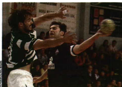
Surpreendente - Águas Santas ao nível do Sporting

sado pelo Águas Santas. Ambas os conjuntos, nesta luta particular entre os seis, somaram apenas duas vitórias, mas os maiatos têm vantagem no confronto directo. Ganharam em casa 28-21 e na Torre da Marinha perderam apenas por um (21-20).