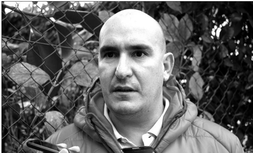
O técnico conseguiu "manter" o Arsenal da Devesa na I Divisão em 2016/2017