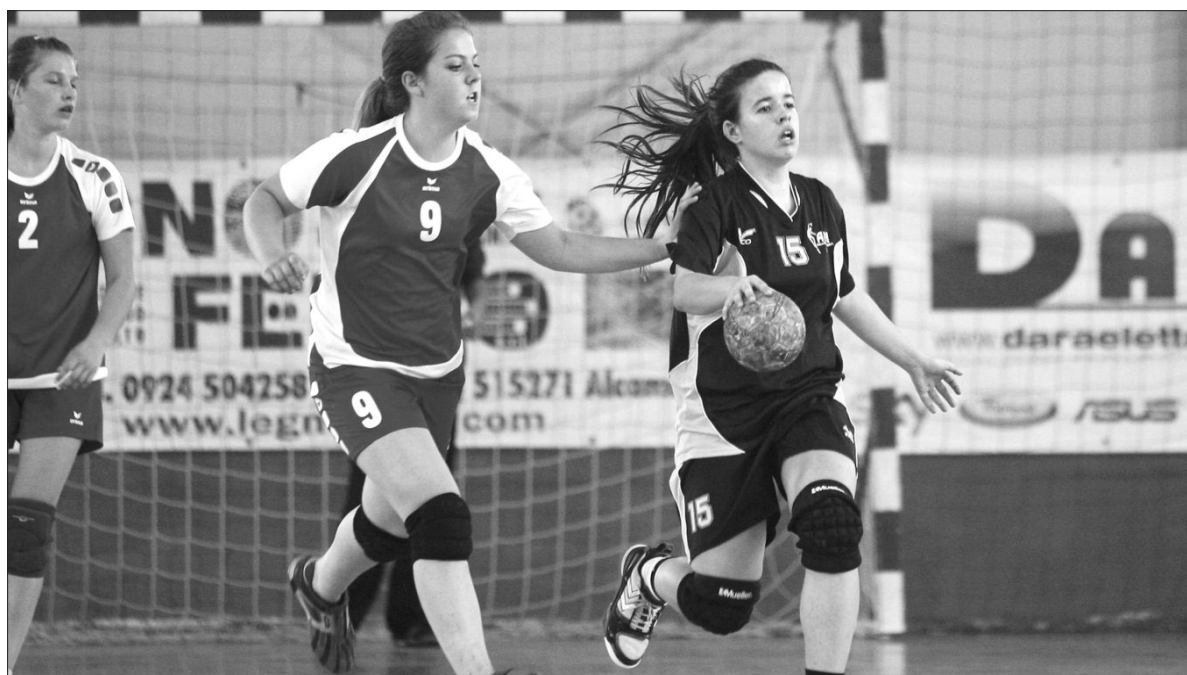
No primeiro dia de competição nos Jogos das Ilhas a Madeira entrou bem no andebol feminino ao vencer facilmente a ilha de Korcula.

No primeiro dia de competição dos Jogos das Ilhas, que está a decorrer na ilha italiana de Sicília, a Madeira entrou bem ao vencer Korcula no andebol, mas somou derrotas no voleibol e basquetebol frente aos Açores e Sardenha, respectivamente.