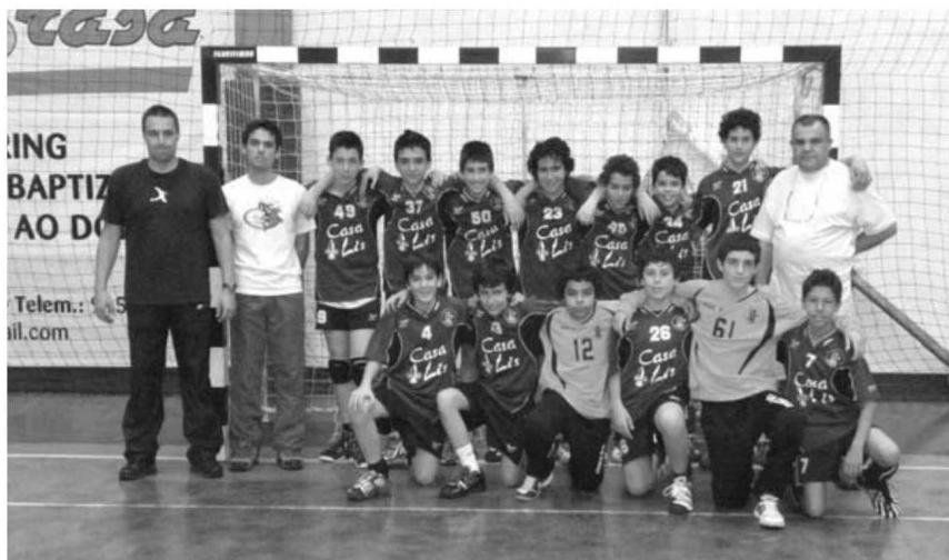
Campeão regional de infantis masculinos volta a conquistar novo título, desta feita na Taça AAM.

No passado fim-de-semana as atenções estiveram viradas para a Taça AAM em infantis e juvenis masculinos, com a disputada das várias 'finais' das diversas séries bem como o jogo derradeiro de atribuição do novo campeão. No escalão mais baixo o campeão re-