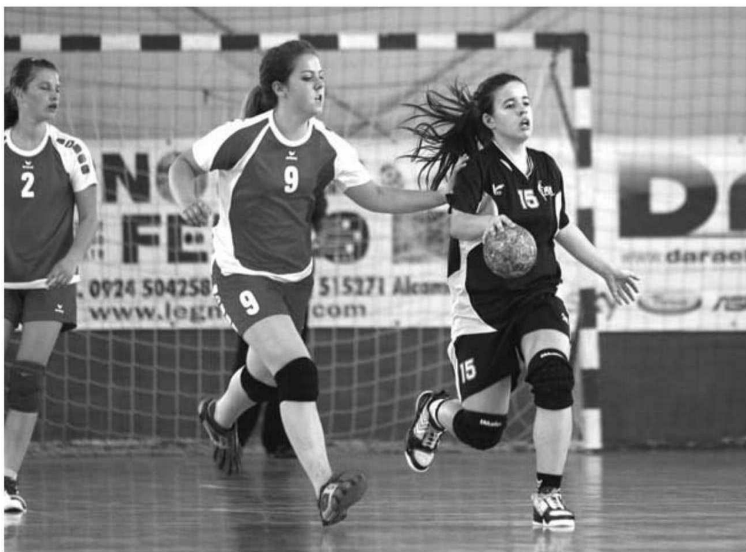
O andebol madeirense tem conquistado sempre bons resultados.

A par de Portugal, que leva a esta edição as representações da