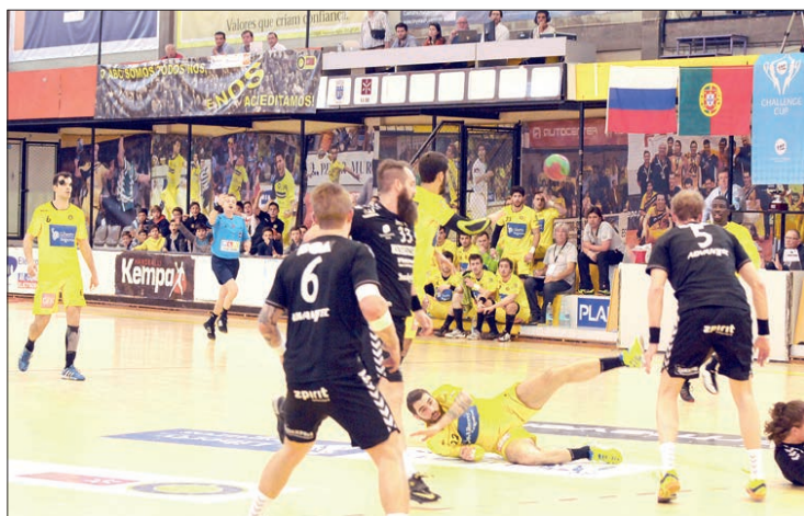
Grilo, um dos melhores da turma academista, por terra