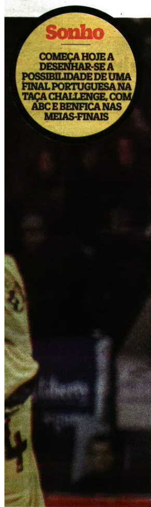
Gençalo Delgado / Global Images