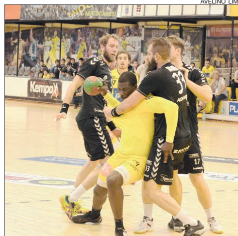
Defesa do Stord muito forte do ponto de vista físico