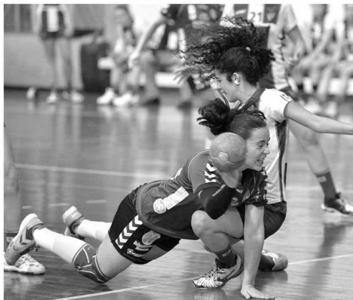
Madeira SAD e Sports terminam hoje a 1.ª fase do Campeonato.