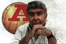
por VÍTOR SERPA

Os clubes já há muito que deixaram de ser o pilar do desenvolvimento desportivo em Portugal. Ninguém os substituiu. A política desportiva é zero!