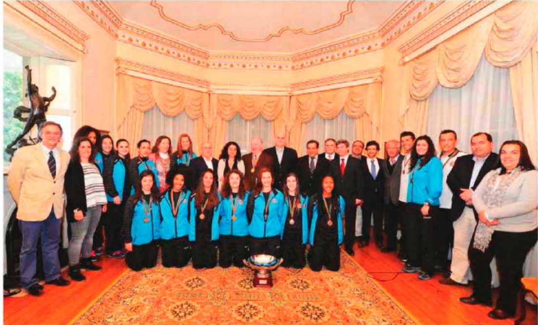
Jardim recebeu ontem a equipa feminina do Madeira SAD, que conquistou a Taça de Portugal.

Já nos masculinos, o Madeira Andebol SAD inicia esta noite, 21