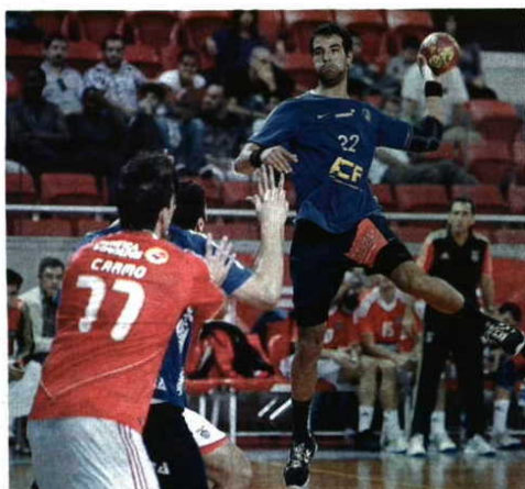
Exemplo Madeira SAD consegue poupar... e ganhar