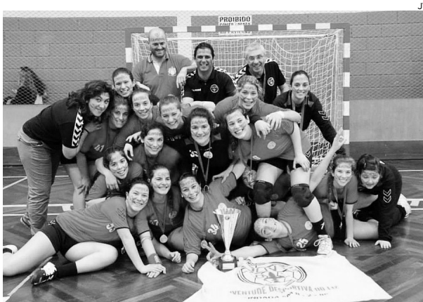
Juve fez a festa em Alpendorada com três vitórias

Com estes resultados, as comandadas de Rui Machado já tinham garantido o título, mas as leirienses voltaram a mos-