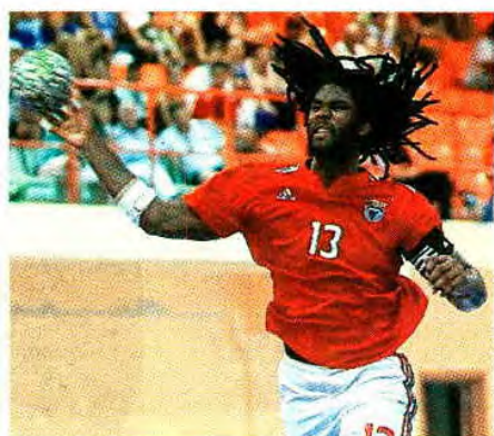
Tony Dias/Global Imagens