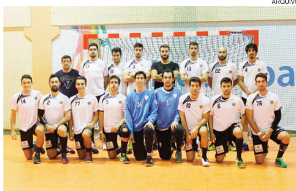
Académico ocupa lugar na primeira metade da tabela

Foi o encontro que dominou as principais atenções da jornada entre duas equipas apostadas em chegar à fase seguinte, tendo terminado com uma igualdade que espelha o equilíbrio entre viseenses e aveirenses, vice-líderes da prova.