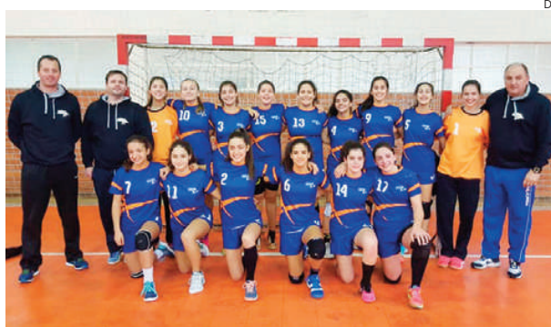
Equipa de Iniciados Femininos competiu em Amarante

A participação na primeira fase da Zona 1, que decorreu em Amarante, foi extremamente positiva para as atletas