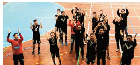
Jogadores da Sanjoanense dedicaram a vitória aos seus adeptos

Na segunda metade, o jogo foi diferente, com o São Bernardo mais acutilante, melhor nas marcações e muito bem na finalização. E nem mesmo um