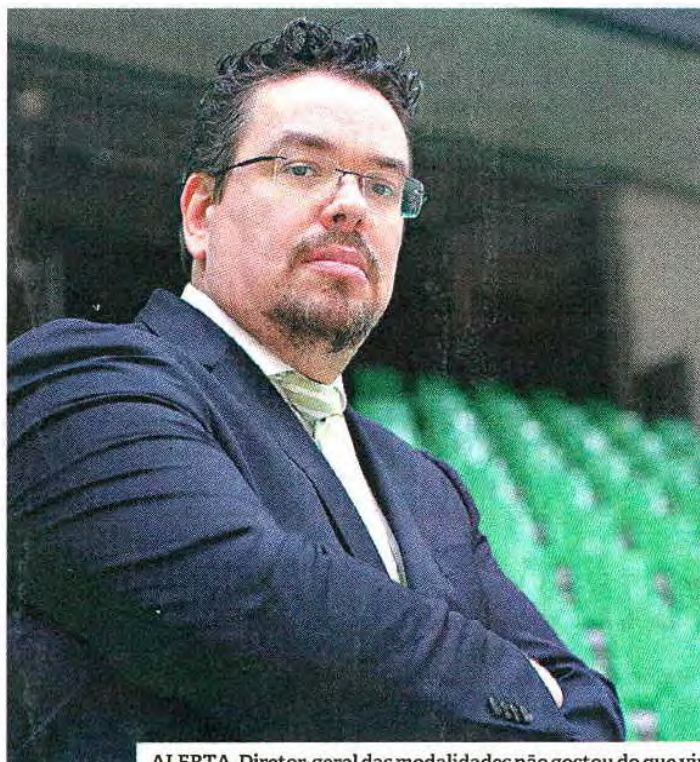
ALERTA. Diretor-geral das modalidades não gostou do que viu