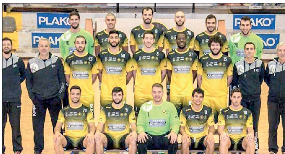
ABC soma por triunfos os dois jogos disputados no grupo B