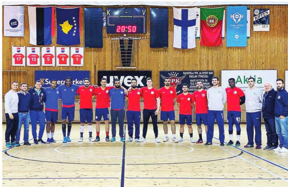
O Madeira SAD voltou a surpreender a Europa.