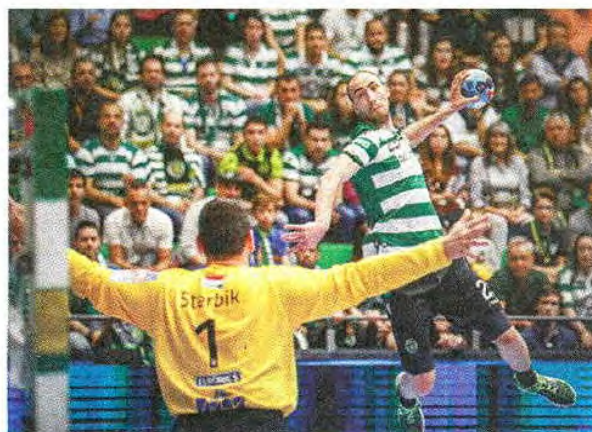
Ghionea marcou sete golos ao experiente Sterbik

Sporting perde com o superfavorito Veszprém mas segue vivo na Champions. Dois golos para tentar recuperar