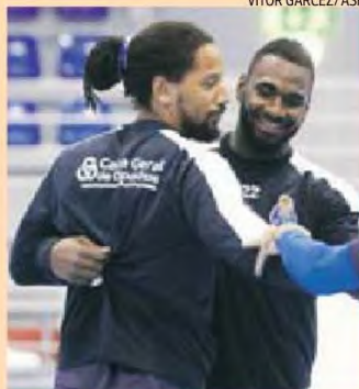
Duarte e Borges já jogaram juntos