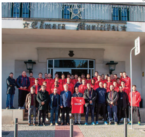
Comitivas foram recebidas nos Paços do Concelho