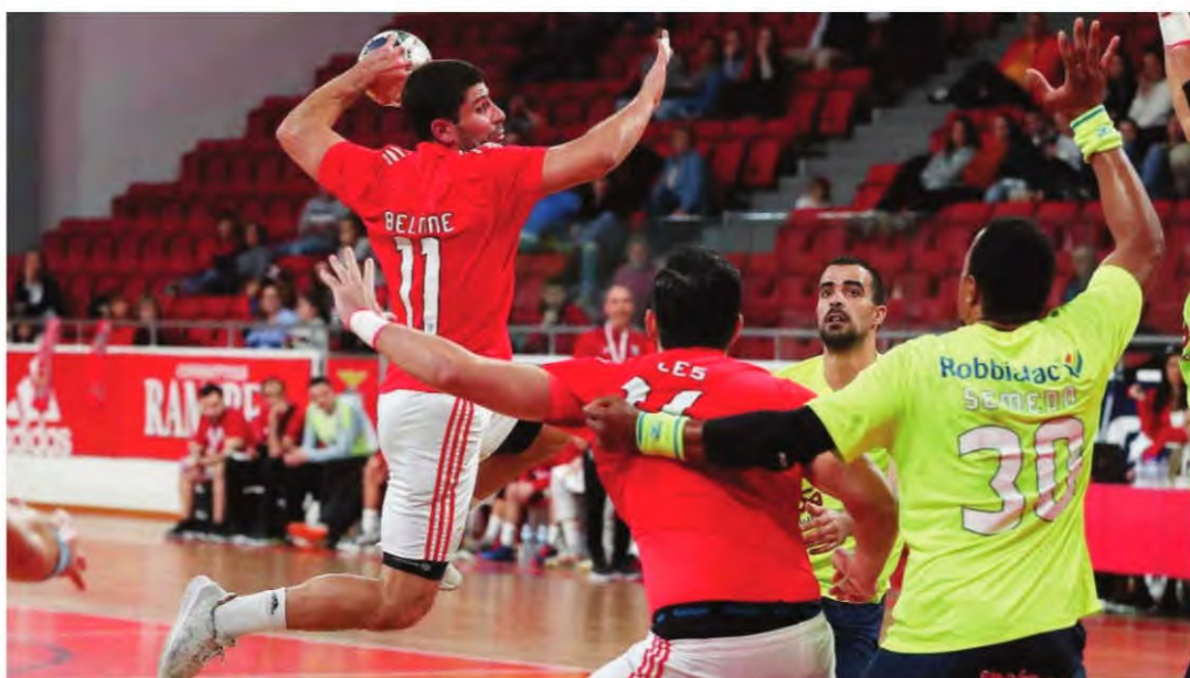
A equipa da casa revelou-se mais forte no segundo tempo.

Uma segunda parte 'demolidora' do Benfica acabou por ditar a derrota averbada ontem (33-25) pelo Madeira SAD, em jogo de acerto de calendário referente à 15.ª jornada