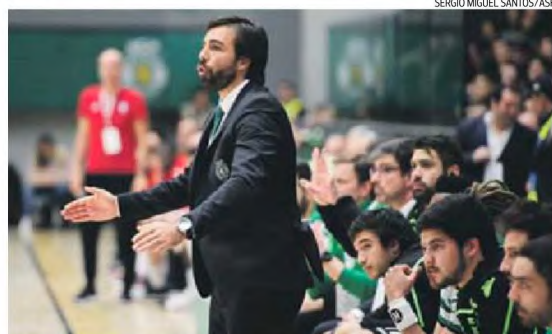
Treinador dos leões não esconde a ansiedade pelo jogo da Liga dos Campeões de domingo