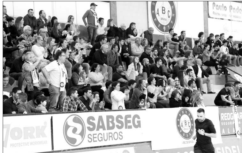
Jogadores do ABC "sentiram" o apoio do seu público

Ainda sobre a partida de sábado passado, o ABC começou mal, esteve mes- mo a perder por cinco go- los na primeira parte e só na etapa complementar é que obteve a primei-