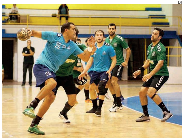
Alavarium e Estarreja AC defrontam-se a 1 de Maio, em Aveiro

Nesta fase nacional, que será disputada no sistema de todos contra todos a duas voltas, os três primeiros classificados garantem, automaticamente, a subida à 2.ª Divisão Nacional, sendo que, quem vencer o grupo, irá ainda disputar o título nacional com o melhor classificado da Zona 2, composta pelas formações do Almada AC, Gil Eanes, Batalha AC, Vela Tavira,