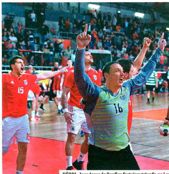
DÉRBI. Jogadores do Benfica festejam triunfo na Luz