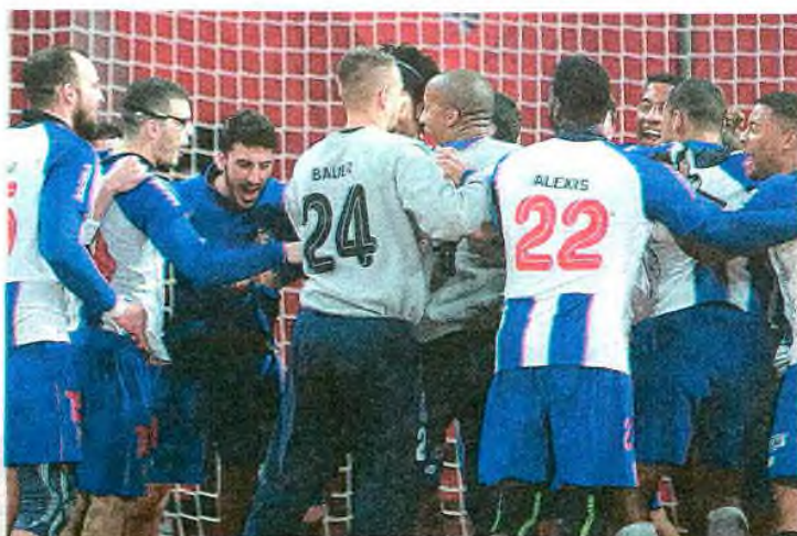
FESTA. Dragões vão lutar por um título no Velho Continente