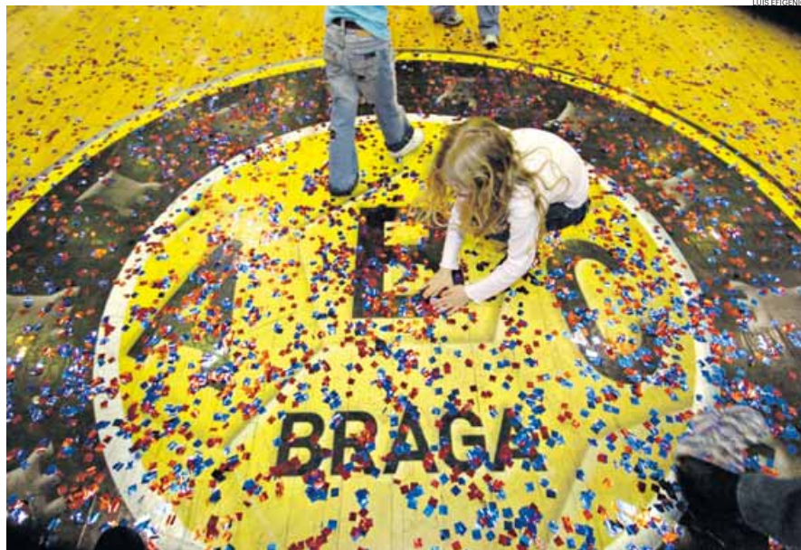
O ABC continua ser o único clube português a ter no currículo uma final da Liga dos Campeões

Os bracarenses conseguiram ultrapassar a fase de qualificação para a Liga dos Campeões, mas a montanha a escalar apenas se tornaria maior na fase de grupos. No sorteio, os croatas do Badel 1862 Zagreb e os noruegueses do Sandefjord HK calharam na rifa aos minhotos. Mesmo junto destes “tubarões”, o treinador ucraniano acreditava que seria possível chegar à final, reservada aos primeiros classificados dos Grupos A e B.