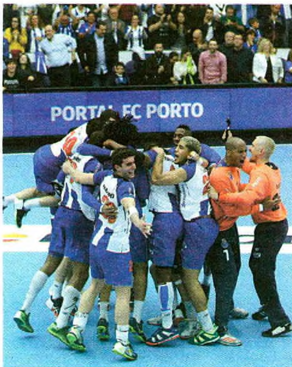
Dragões festejaram bastante a qualificação europeia

Num jogo equilibrado, os últimos cinco minutos da primeira parte foram decisivos. Aos 25 minutos os franceses conseguiram pela primeira vez uma vantagem