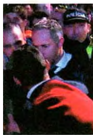
AGITAÇÃO. Sérgio Conceição deixou os balneários com Pinto da Costa, mas optou por encerrar de perto os adeptos e trocar algumas palavras

O FC Porto, através da sua newsletter Dragões Diário, mesmo sem ter apontado o dedo com veemência à arbitragem de Artur Soares Dias, deixou dois reparos à atuação do juiz do Porto. No primeiro, à passagem do minuto 8, é considerado que "Marega foi carregado pelas costas na área do Rio Ave", num lance com Rúben Semedo. Mais tarde, aos 61 minutos, os portistas entenderam que o central da equipa vila-condense "jogou a bola com a mão dentro da área" também num lance disputado com o avançado do FC Porto. Feitas as contas, os dragões reclamaram a marcação de dois penáltis a seu favor na noite de sexta-feira. No primeiro o resultado ainda estava em branco, ao passo que no outro estava favorável aos portistas por 2-0.