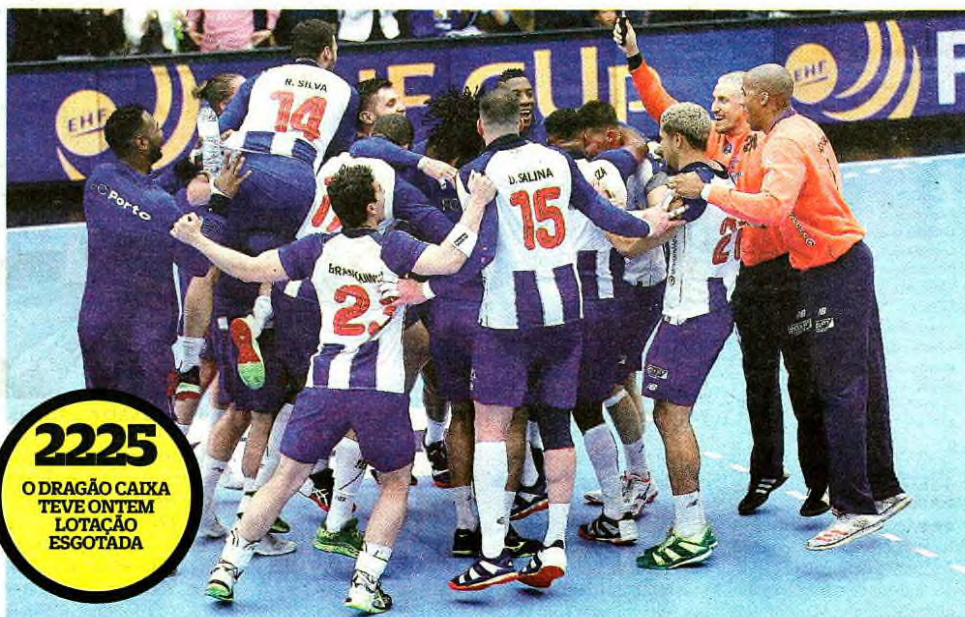
FC Porto garantiu o momento mais alto do seu andebol a nível europeu e os jogadores festejaram efusivamente

Num ambiente extraordinário, com a lotação do Dragão Caixa esgotada, os atletas do FC Porto mostraram uma capacidade pouco comum, mantendo-se serenos o suficiente para aguentar 12 situações de igualdade e, mais que isso, ver uns gauleses feridos no seu orgulho a quererem arrancar (12-14 e 13-15, este aos 26') e, mesmo assim, ainda na primeira parte, a darem a volta e irem para o intervalo a vencer por 17-15, após um parcial de 4-0 vindo de um... time-out.