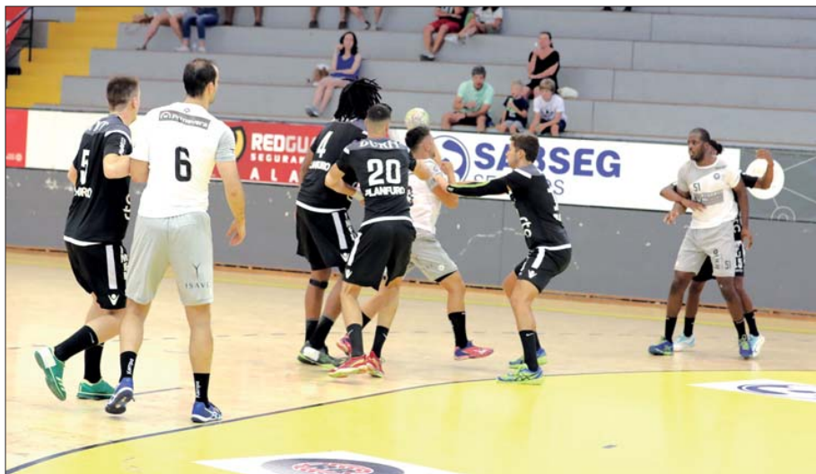
ABC venceu Avanca sem dificuldades

ABC/UMinho venceu ontem o Avanca, por 39-31, e continua a liderar o grupo B só com triunfos.