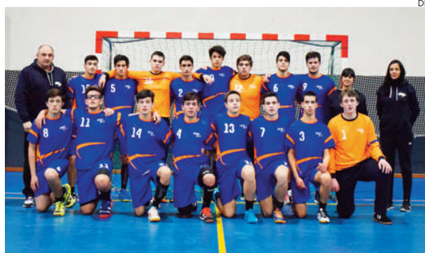
Seleção de Viseu/Guarda perdeu os dois encontros disputados

Contra a selecção da Associação de Andebol do Porto, a derrota não surpreendeu, confirmando que na área por-