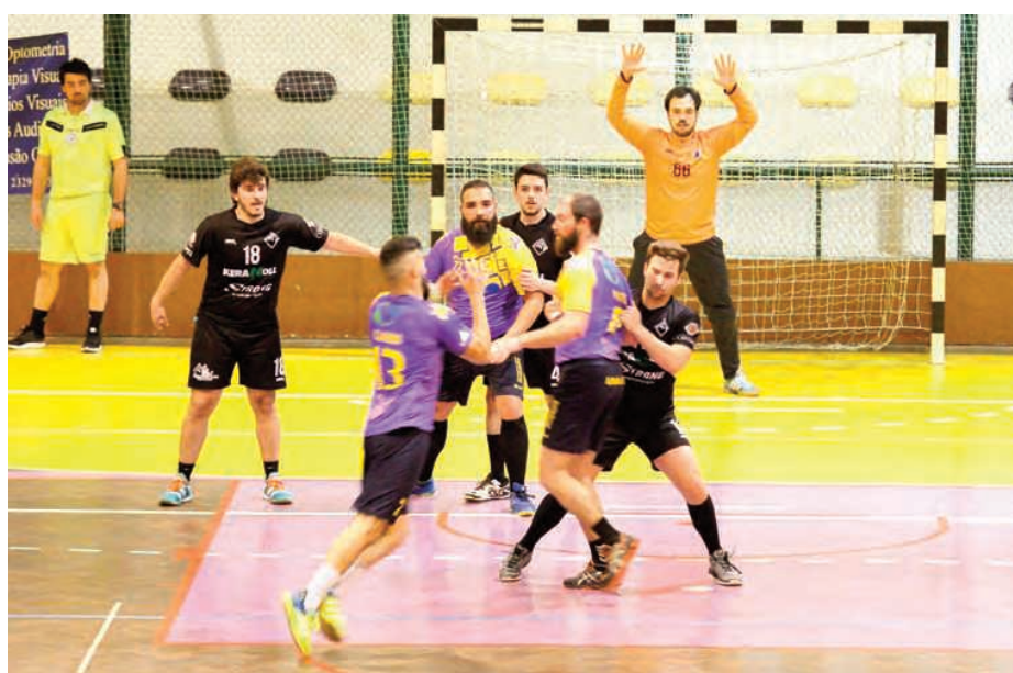
Académica triunfou no reduto do Carregal do Sal na penúltima jornada do Nacional da 3.ª Divisão

Uma vitória suada, mas justa, que veio consolidar a equipa