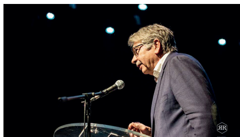
Artística de Avanca , Clube do Ano