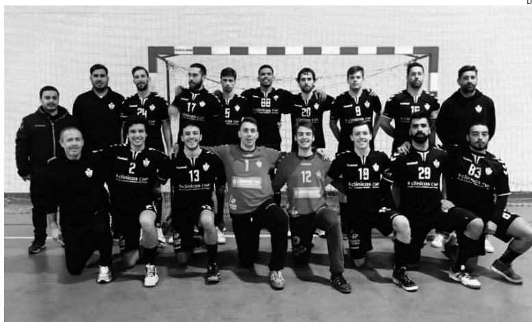
Equipa da Sanjoanense , vencedora da Zona 2 do Campeonato Nacional da 2.ª Divisão