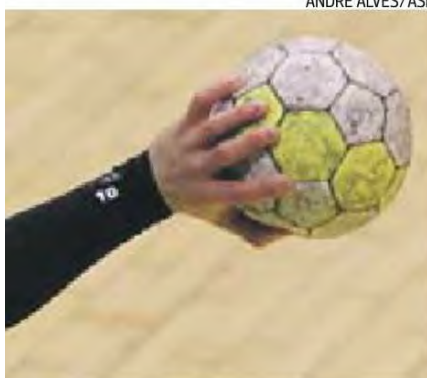
Caso de violência no andebol português