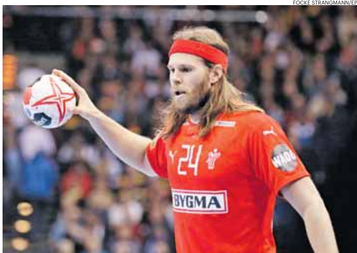
Mikkel Hansen, 12 golos, voltou a ser a grande figura da Dinamarca