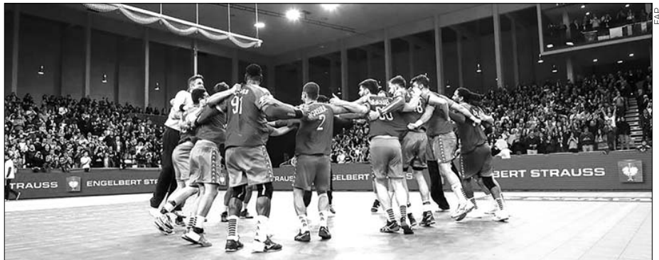
Seleção portuguesa deu um grande passo rumo ao europeu

Em jogo disputado no Multiusos de Guimarães, a equipa lusa, que ao intervalo já vencia por 16-14, ultrapassou uma das grandes potências da modalidade e fica assim em excelente posição de garantir um dos dois primeiros lugares do grupo, que lidera com seis pontos, resultantes de três vitórias em outros tantos en-