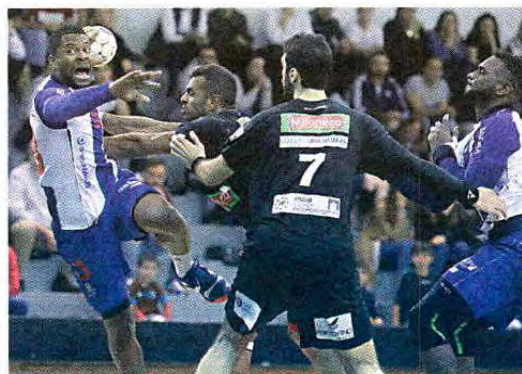
Dragões tiveram de se aplicar a fundo na Maia