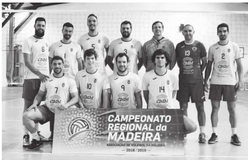
Equipa de seniores masculinos da ADRAP sagrou-se campeã regional.