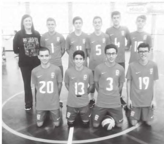
Na categoria de juvenis, o campeão chama-se CS Marítimo.