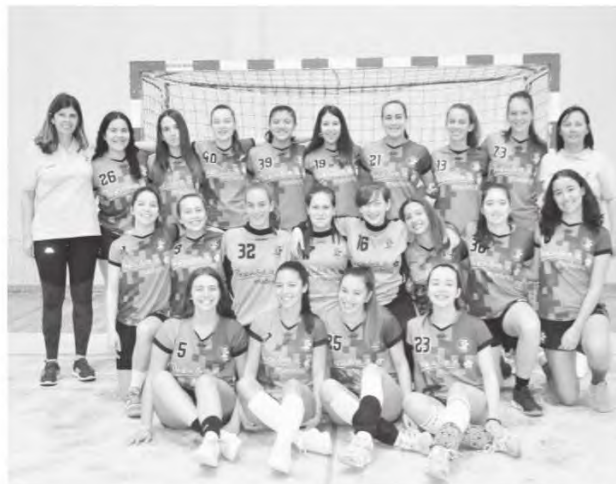
O CD Bartolomeu Perestrelo domina no número de títulos no andebol feminino de formação.

"Há todos os atributos para a conquista do título, mas acima de tudo a vontade 'férrea' para evoluir e que-