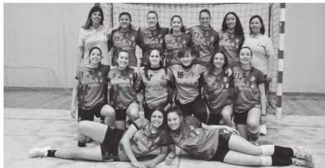
A Bartolomeu Perestrelo também arrecadou o título de campeão de iniciados.

A formação escolar da Bartolomeu Perestrelo também arrecadou o título de campeão de iniciados. Mais um sucesso de uma equipa com muitas atletas oriundas do estabelecimento escolar que também evoluiu com o decorrer da competição. A diferença entre o início de temporada e a final do campeonato regional é