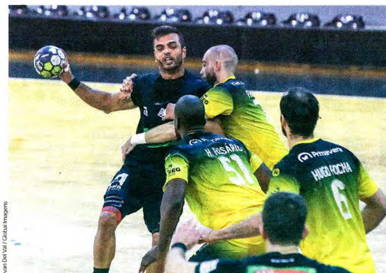
Ivan Del Val / Global Images

A defesa do ABC sentiu sempre dificuldades para segurar Pedro Cruz