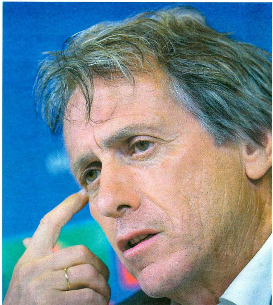
Jorge Jesus confirma a proposta do Flamengo, mas garante que tem outras ofertas em carteira