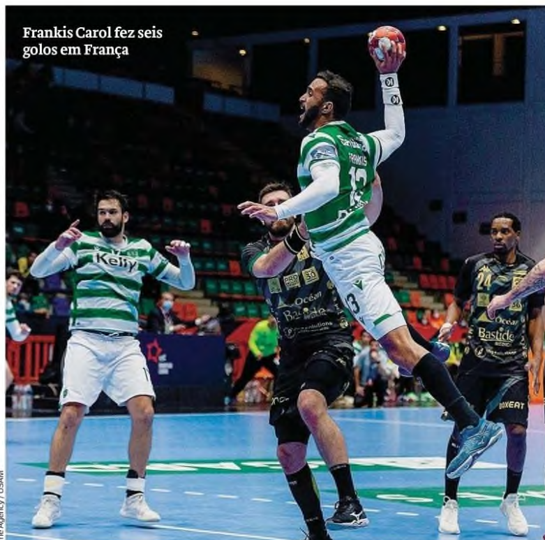
The Agency / USAM