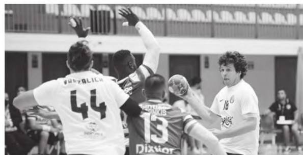
Madeira SAD empatou no dérbi insular.

Chegou primeiro o Madeira SAD aos 30 golos mas os açorianos conseguiram o empate perto do final da partida e fixaram o resultado em 30:30.