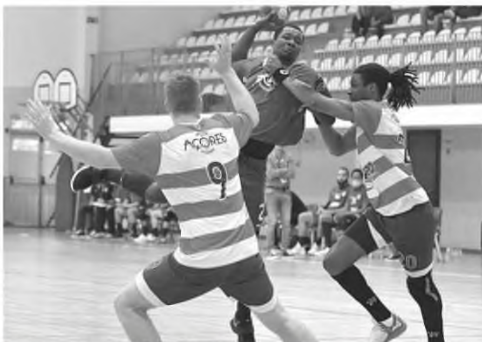
Madeirenses somaram o terceiro empate na época.

Do Madeira Andebol SAD há que dizer que este foi uma partida que, no fundo, traduz o que será este campeonato nacional para os madeirenses. Num quadro onde apenas os chamados três grandes estão