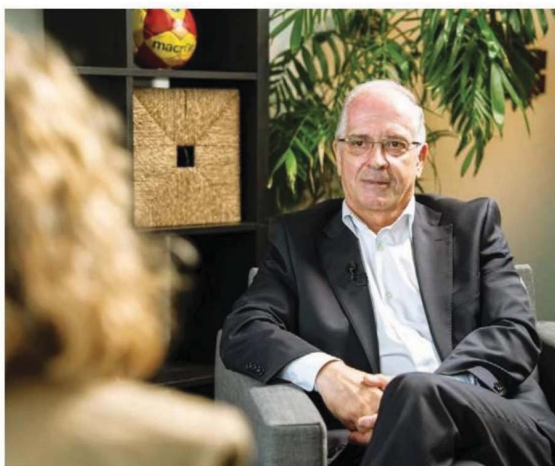
Este é o terceiro mandado do presidente da Federação de Andebol, Miguel Laranjeiro

— Sem dúvida. Temos apostado muito na escola, através de projetos como o 'Handball for Kids' e o 'Masterplan' da Federação Europeia. É na escola que estão os jovens do futuro. Criámos uma relação muito positiva entre clubes, autarquias e escolas. E eu sou radical na igualdade de oportunidades: todos os jovens deviam experimentar várias modalidades. O importante é praticarem desporto.